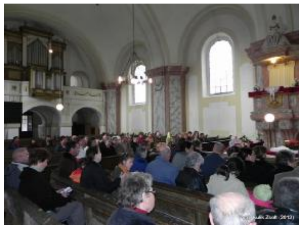
A Húsvétvasárnapi gyülekezet egy csoportja További képek: http://ocsodref.fw.hu