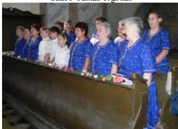
Az Öcsödi Hagyományörző Népdalkör énekel