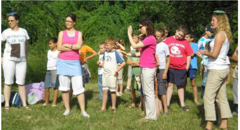
Missziós gyermeknap játszóház