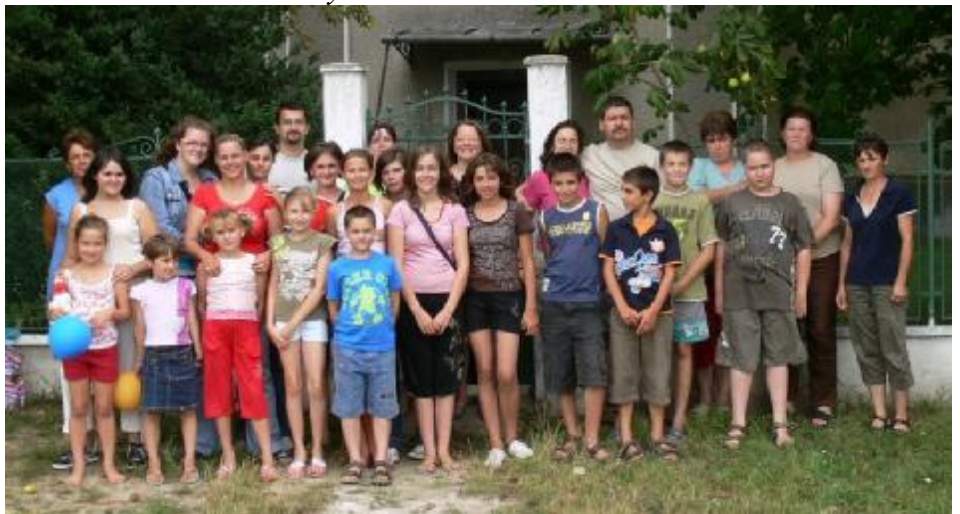
Gyermek-Biblia-hét Érkeserű Még több kép: http://ocsodref.fw.hu