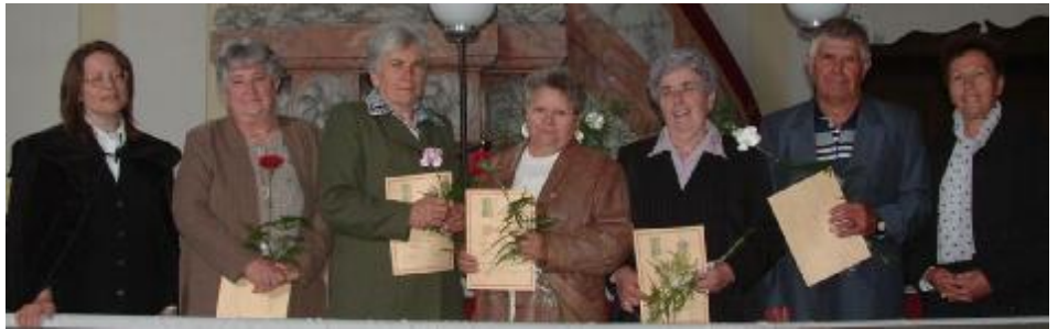
50 éve konfirmáltak találkozója